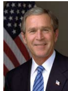
George W. Bush